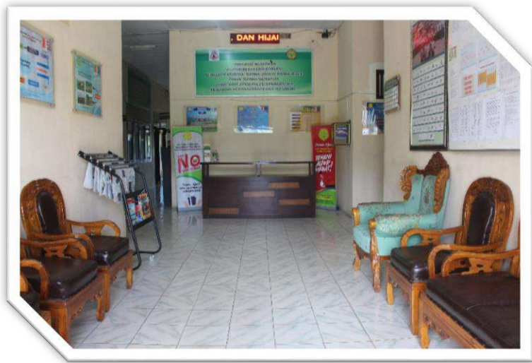
Gambar 2. Ruang Tunggu/Ruang Tamu BPTU - HPT Indrapuri

Disamping penyediaan ruang/loket/meja layanan informasi, guna mengakomodasi kepentingan publik untuk mengakses layanan permohonan informasi secara efektif dan efisien, tersedia aplikasi online Silayan yaitu