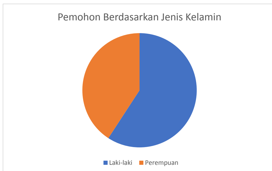
Grafik1. pemohon berdasarkan jenis kelamin

Pemohon informasi publik ke BPTU-HPT indrapuri di tahun 2019, yaitu sebanyak 161 orang laki-laki dan sebanyak 111 orang perempuan.