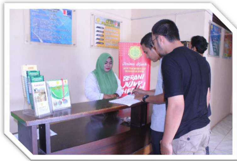
Gambar 1. Desk Layanan BPTU - HPT Indrapuri